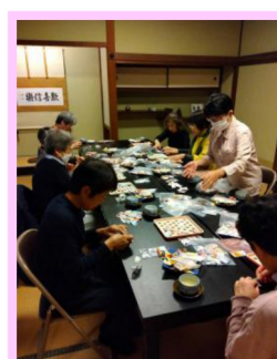
11月16日 ワークショップ