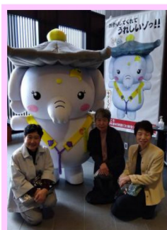
11月15日 津村別院報恩講